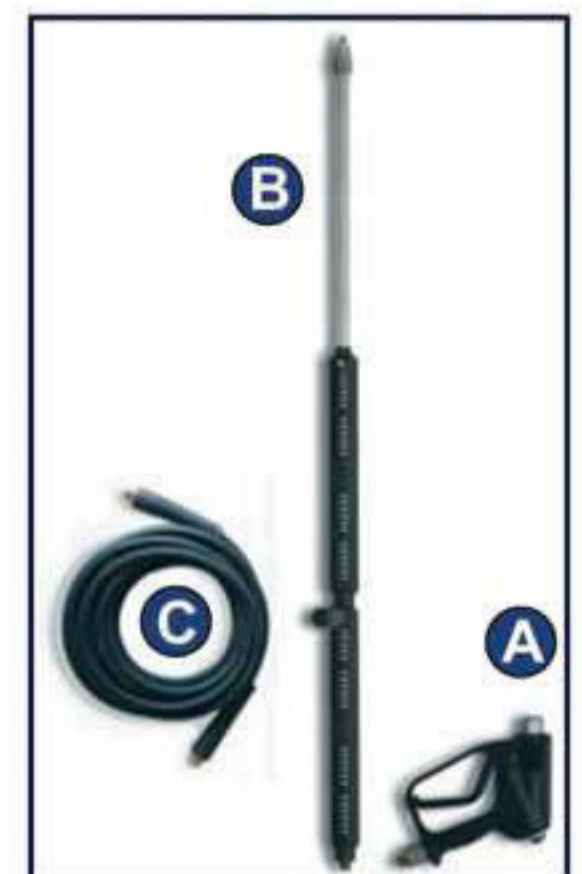
A Pistola B Lanza C Manguera A.P.

Bomba Industrial Pratisoli 3 pistones cerámicos y Sistema biela/cigüeñal. Regulación de la presión. Válvula termostática Manómetro. Filtro entrada agua Transmisión por acoplamiento elástico. Aspiración detergente incorporada. Manguera A.P. 20 mt., pistola RL y lanza.