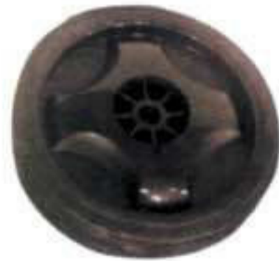
P 1019. Tapacubos rueda 200 Ø