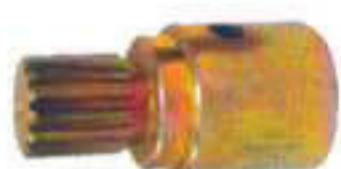
E 12002. Piñón acoplamiento corto