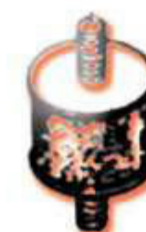
M 2076. Silenblock.