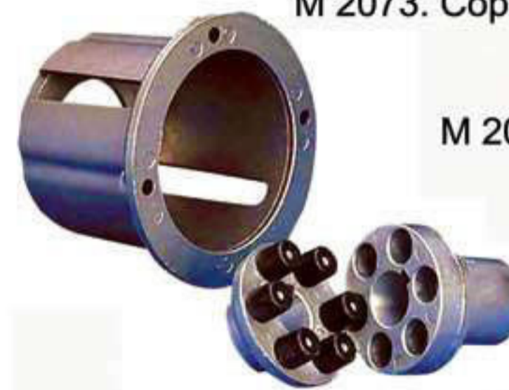
M 2074. Junta elástica para copa