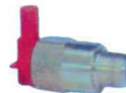
M 2082. Válvula termostática.