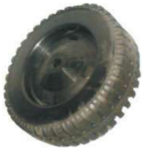
P 1016. Rueda goma 200 Ø