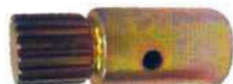
E 12003. Piñón acoplamiento largo