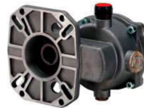
M 2075. Reductor para motor de explosión.

S 11002. Modelo MP-21. Para máquinas modelos TR 200-25, TR 200-30 y TR 300-21. Potencia absorbida: 25 cv.